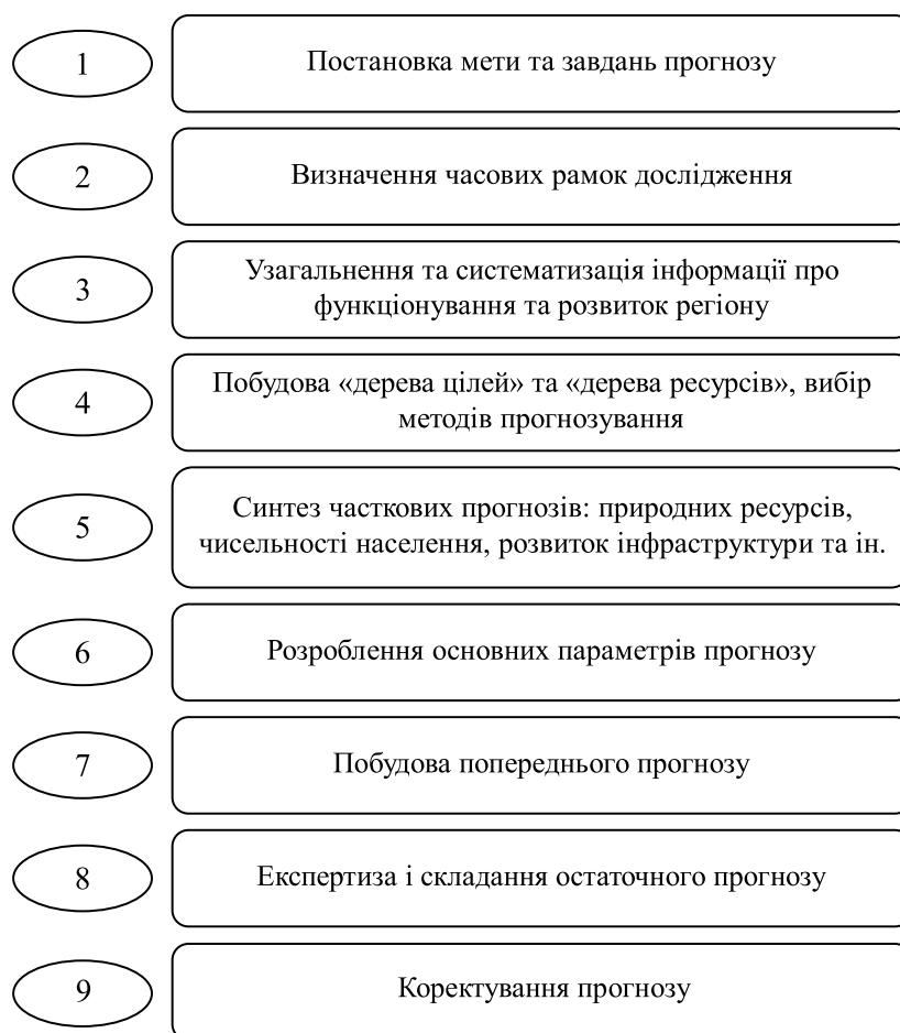
Рисунок 2. Етапи розроблення прогнозу соціально-економічного розвитку регіону