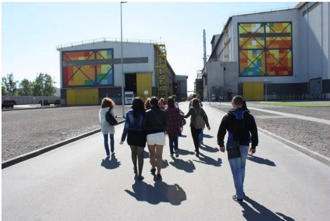
Рисунок. 2 Екскурсія студентів Дніпропетровського національного університету ім. Олеса Гончара на завод Інтерпайп Сталь під час навчальної практики

Безперечно, віднесення деяких об'єктів до певного виду індустріальної спадщини є дискусійним. Наприклад, зруйнований Донецький аеропорт вже нині майже не існує як матеріальний об'єкт та й розташований на території, не підконтрольній українській владі. До того ж невідомо, який вигляд він матиме згодом. Однак цінність і значущість його настільки значна, що вона повинна бути збережена принаймні як місце визначних подій. Інший приклад – неушкоджена військова техніка вже мандрує Україною як туристичний об'єкт, на центральних площах великих міст вона представлена для огляду, волонтери й учасники бойових дій проводять на її основі екскурсії. Згадаймо також виставки, експонатами якої представляють події Революції гідності та АТО (наприклад, в Історичному музеї ім. Яворницького, Дніпропетровськ). Це все – вже наша історія, яка твориться зараз, на наших очах, вона вже зафіксована у матеріальних об'єктах. Найчастіше учасниками таких екскурсій є діти, які представляють аудиторію, відкрити до пізнання особливо новітніх подій.