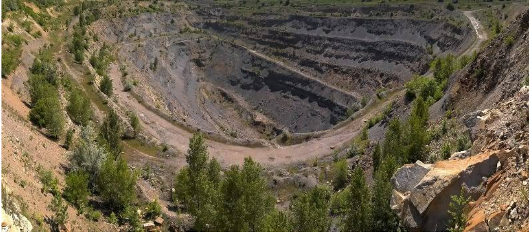
Рисунок 3. Старі кар'єри – один з найпривабливіших об'єктів для туристів-екстремалів

природоохоронні об'єкти, організовані після рекультивації відпрацьованих кар'єрів, відвалів та ін.); екстремальний (використання промислових зон, закритих або діючих кар'єрів, мостів, інженерних споруд та комунікацій для екстремальних видів спорту; відвідування, покинутих і недобудованих промислових об'єктів з метою дослідження, фотографування, отримання психологічного задоволення); оздоровчий (відпочинок у рекреаційних зонах, галотерапія у соляних шахтах, організованих на місці рекультивованих відвалів, поблизу закритих кар'єрів тощо).