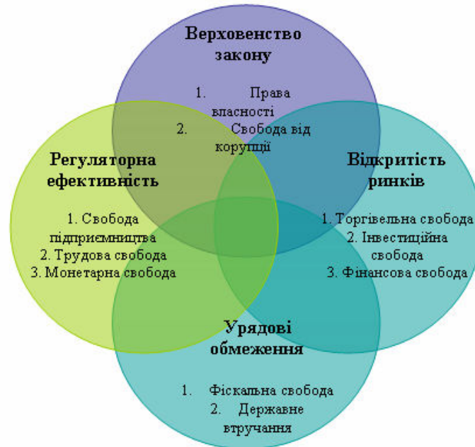
Рисунок 1. Категорії та напрями оцінювання при розрахунку індекса економічної свободи Index of economic freedom (Heritage index)

Експерти вивчають 4 категорії, які формуються з окремих напрямів оцінювання (рис. 1, табл. 1).