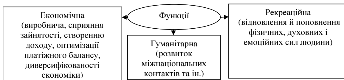
Рисунок 2. Функції міжнародного туризму в сучасних умовах глобалізації

Можна стверджувати, що сутність і зміст міжнародного туризму як економічної категорії відображає функціональну спрямованість його впливу на формування сучасної глобальної економічної системи, що проявляється в триєдності виконуваних функцій (рис.2).