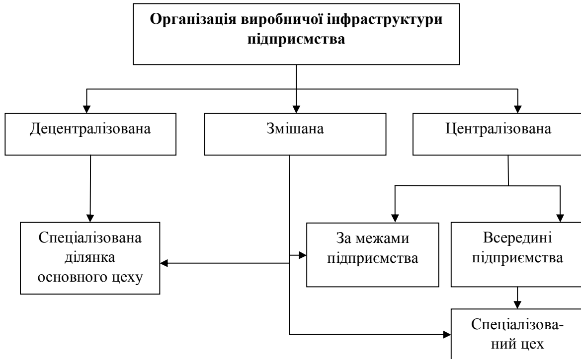
Рисунок 1. Класифікація видів організації виробничої інфраструктури промислового підприємства*