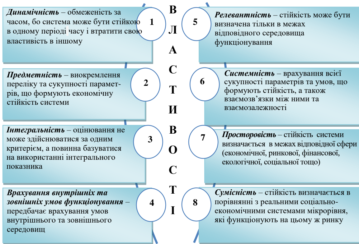
Рисунок 2. Основні властивості категорії «економічна стійкість соціально-економічної системи»