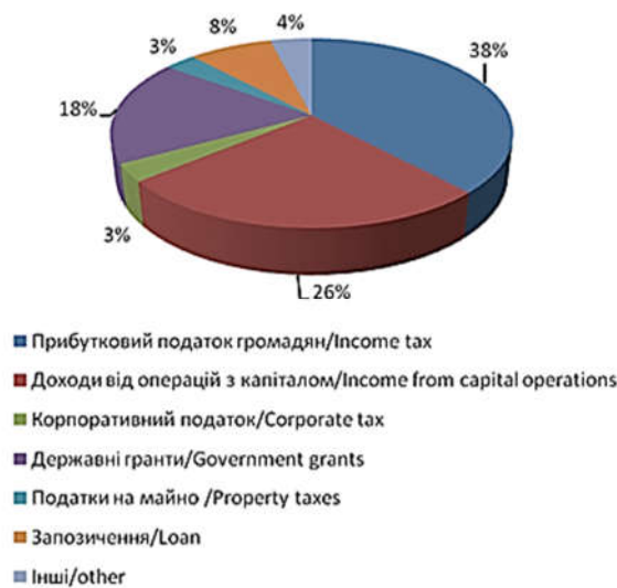
Рисунок 2. Структура доходів місцевих бюджетів у Фінляндії