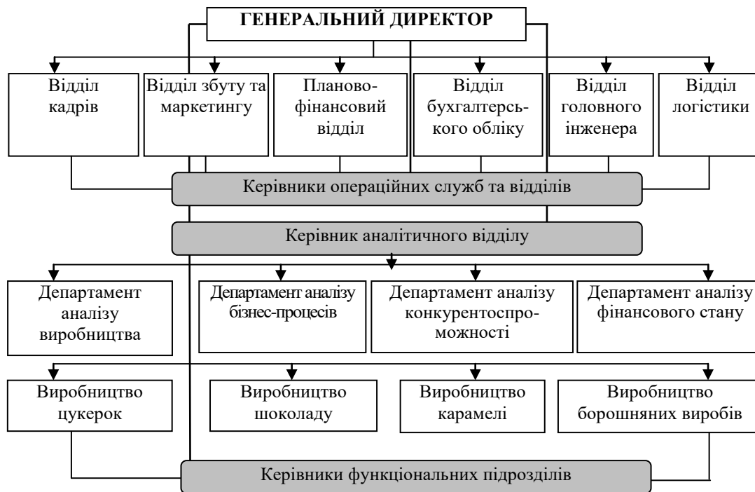
Рисунок 3. Дивізійно-продуктова організаційна структура аналітичного відділу підприємства кондитерської галузі