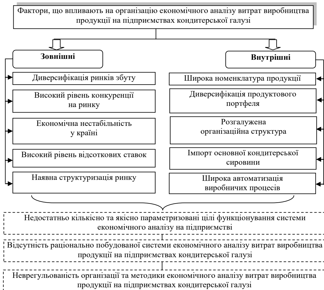
Рисунок 1. Фактори, що впливають на організацію економічного аналізу витрат виробництва продукції

При визначенні складових організації економічного аналізу витрат на підприємствах кондитерської промисловості слід виокремити галузеві фактори, що впливають на організацію аналізу на цих підприємствах загалом (рис. 1).