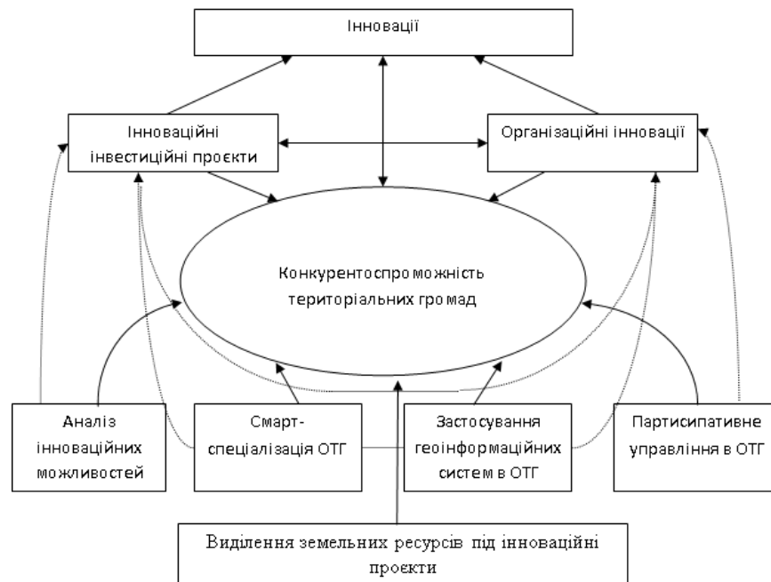
Рисунок 1. Інструментарій формування інноваційної складової підвищення конкурентоспроможності ОТГ

Отже, узагальнюючи наведені ключові елементи запропонованого інструментарію підвищення інноваційної складової конкурентоспроможності ОТГ, можна запропонувати схему реалізації та застосування даного інструментарію в процесі планування й управління діяльністю територіальної громади (рис. 1).