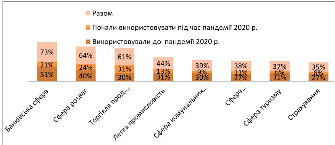
Рисунок 2. Динаміка впровадження цифрових технологій підприємствами в період пандемії