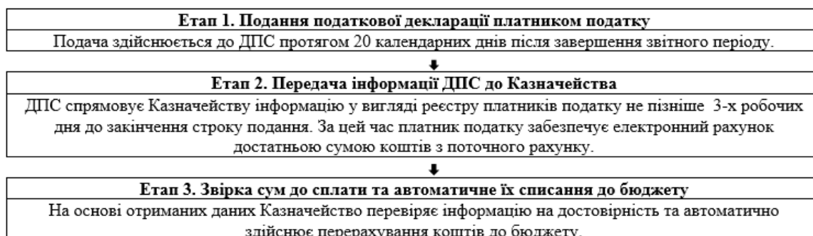
Рисунок 2. Послідовність погашення ПЗ з ПДВ [4]