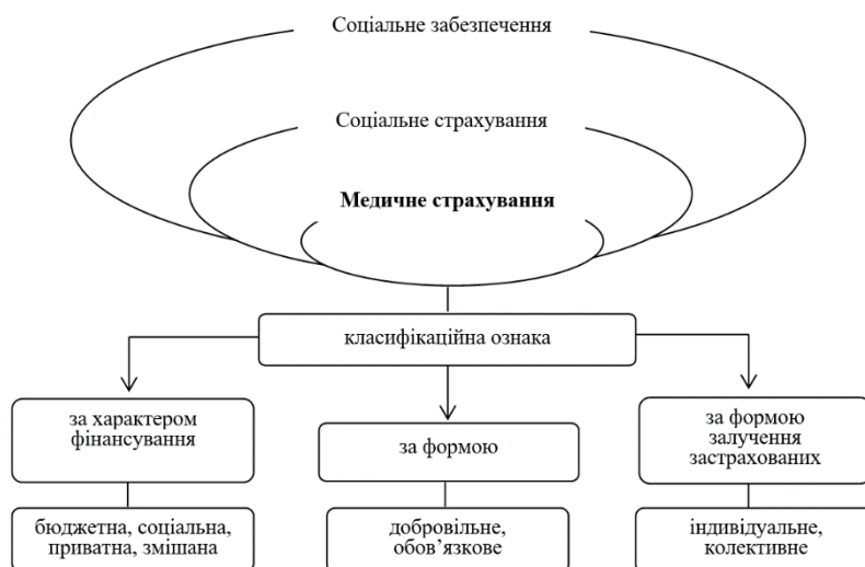
Рисуюнок 1. Медичне страхування: місце в системі соціального забезпечення та класифікація

Аналіз теоретичних основ дозволив візуалізувати місце медичного страхування в системі соціального забезпечення країни, а також представити його класифікацію (рис. 1).