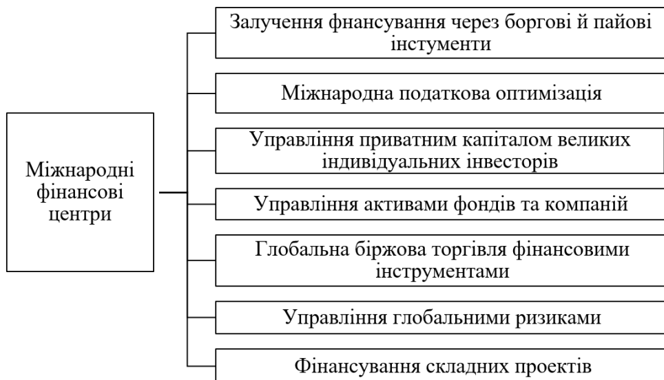
Рисунок 3. Види МФЦ [5]

Існує сім основних видів діяльності, якими сьогодні займаються міжнародні фінансові центри: деякі МФЦ здійснюють не всі з представлених видів діяльності (рисунок 3). Однак такі масштабні міста, як Лондон і Нью-Йорк здійснюють усі види діяльності.