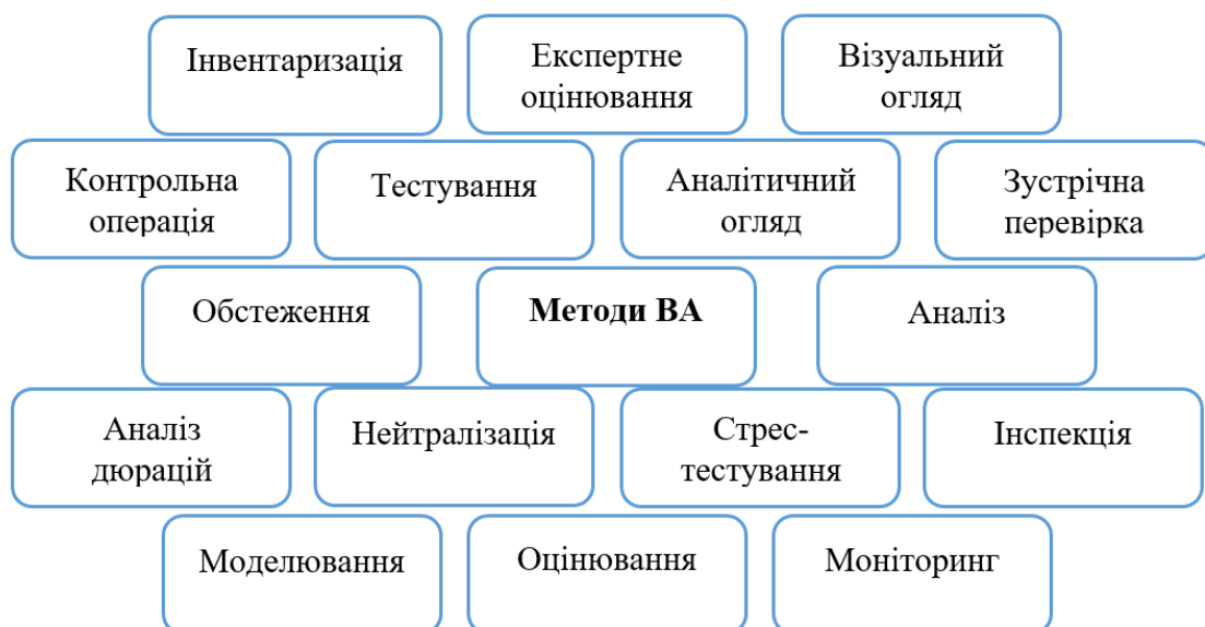
Рисунок 1. Методи ВА

На сьогодні діяльності підприємств притаманна значна різноманітність ризиків, що, відповідно, вимагає методів дослідження з широким спектром можливостей (рис. 1):