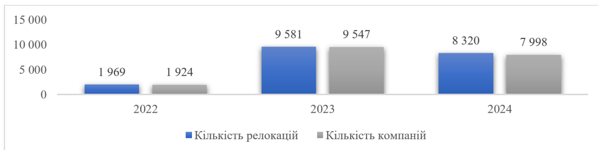
Рисунок 1. Кількість релокацій підприємств по Україні впродовж 2022–2024 рр., од.

Наразі істотним викликом є також мобілізація персоналу та релокація підприємств (рис. 1).